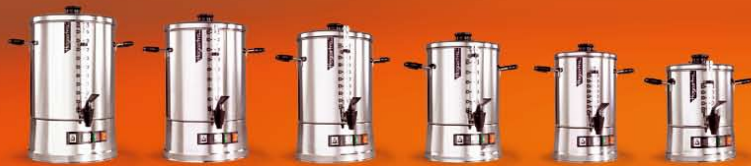
CNS 160 15-160 Tassen CNS 130 15-130 Tassen CNS 100 15-100 Tassen CNS 75 15-75 Tassen CNS 50 15-50 Tassen CNS 35 15-35 Tassen

Die Hogastra-Kaffeautomaten ersparen Ihnen das ständige Hantieren mit Glaskrügen und halten immer herrlich duftenden Kaffee bereit.